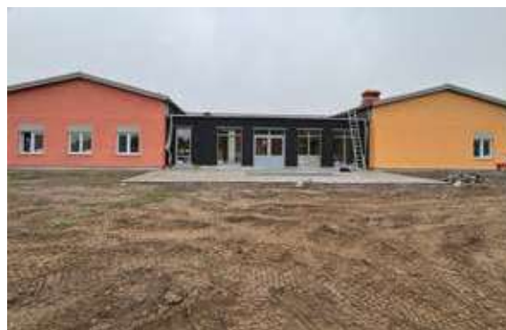
Nyproduktion pågår LSS Höjdgatan.

2025 Togs spadatag för ett nytt LSS-boende på Höjdgatan som planeras stå färdigt 2026. Under året beslutades även att uppföra ett nytt Särskilt boende på Älgstigen. Upphandling genomförd men bygglovets överklagats av grannar.