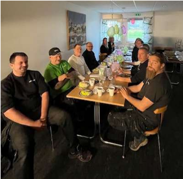
Firande att 500 badrumsrenoveringar är klara