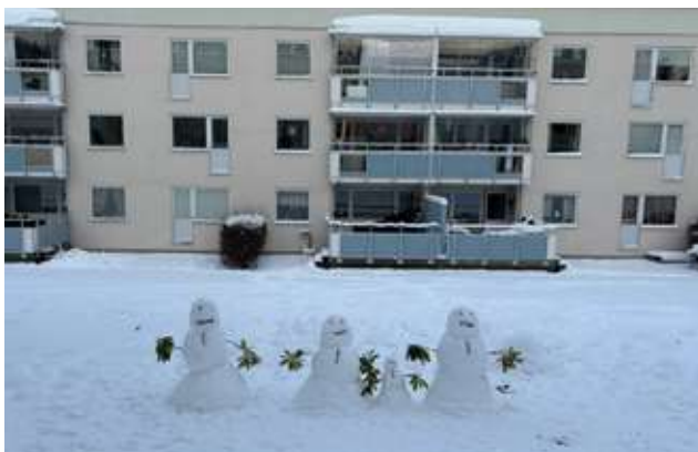
Snögubbsfamilj på Kullborg

Vi har en bra fungerande felanmälan med snabb återkoppling och utförd åtgärd, en bra omflyttningsfrekvens på 19,5% och en hög intern omflyttning som visar att man vill bo kvar hos oss. NKI undersökning låg högt 2024, på hela 84,1%.