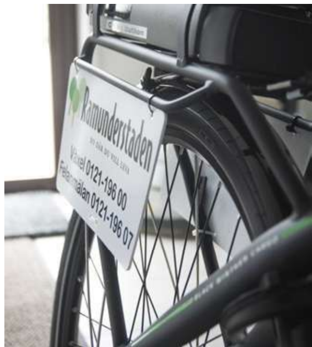
En av Ramunderstadens två elcyklar

Vi har en bra direktavkastning på 3,66%, och ett snitt för fyraårsperioden på 3,3%. Soliditeten ligger på 19,8% och vi har ett lågt antal tomhyror.