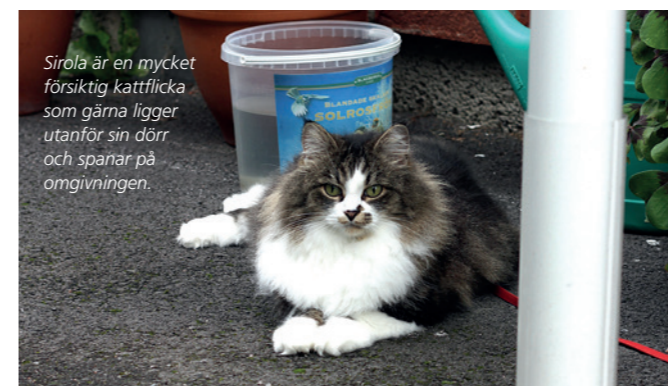
Sirola är en mycket försiktig kattflicka som gärna ligger utanför sin dörr och spanar på omgivningen.