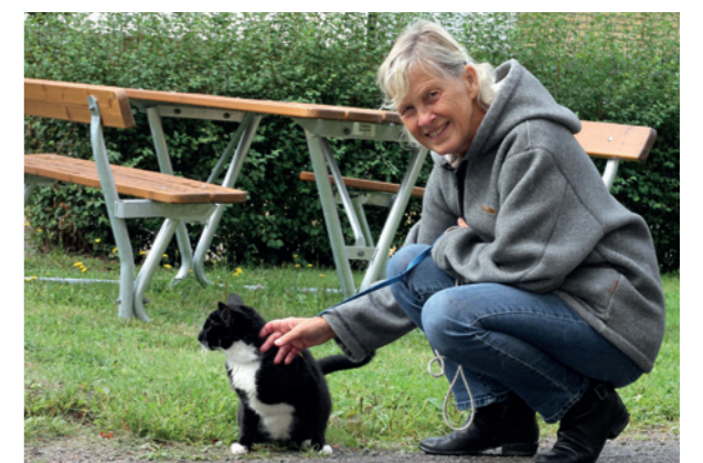
Katten Evert älskar promenader men är skeptisk mot regndropparna, som faller när vi fotograferar.