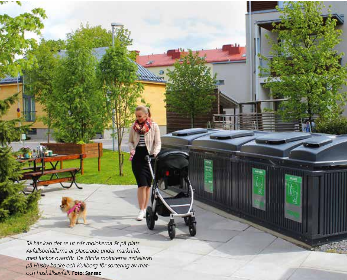
Så här kan det se ut när molokerna är på plats. Avfallsbehållarna är placerade under marknivå, med luckor ovanför. De första molokerna installeras på Husby backe och Kullborg för sortering av mat- och hushållsavfall.